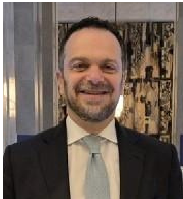
Il Console Generale d'Italia Francesco Capechi.

L'intervista si è conclusa con un augurio speciale: realizzare i nostri sogni e ritrovarci un giorno, cresciuti e soddisfatti del nostro percorso.