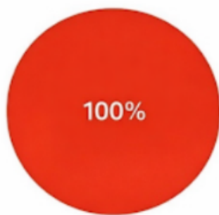
Risultato del sondaggio

La psicologia sociale ci insegna che avere molte relazioni, anche leggere, aumenta il senso di appartenenza e riduce l'isolamento. Più amici superficiali significano più contatti, più opportunità professionali e sociali, più circolazione di idee. E poi come e si sente quando si entra in un posto e tanti volti si illuminano?